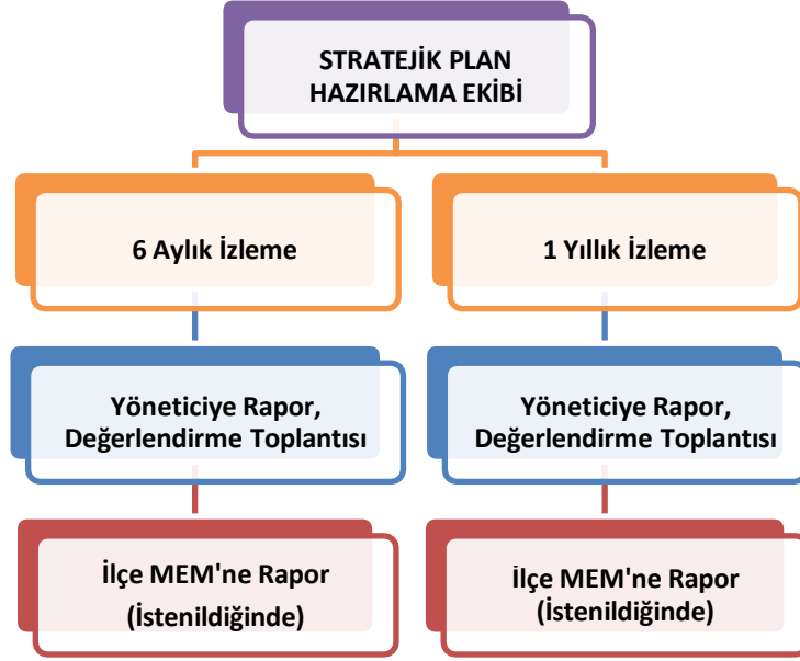
Şekil: İzleme ve Değerlendirme Süreci

İzleme, stratejik planın uygulanmasının sistematik olarak takip edilmesi ve raporlanması anlamını taşımaktadır. Değerlendirme ise, uygulama sonuçlarının amaç ve hedeflere kıyasla ölçülmesi ve söz konusu amaç ve hedeflerin tutarlılık ve uygunluğunun analizidir. Okulumuz Stratejik Planının onaylanarak yürürlüğe girmesiyle birlikte, uygulamasının izleme ve değerlendirmesi de başlayacaktır. Planda yer alan stratejik amaç ve onların altında bulunan stratejik hedeflere ulaşılabilme için yürütülecek çalışmaların izlenmesi ve değerlendirilmesini zamanında ve etkin bir şekilde yapabilmek amacıyla Okulumuzda Stratejik Plan İzleme ve Değerlendirme Ekibi kurulacaktır. İzleme ve değerlendirme, planda belirtilen performans göstergeleri dikkate alınarak yapılacaktır. Stratejik amaçların ve hedeflerin gerçekleştirilmesinden sorumlu kişiler 6 aylık veya yıllık dönemler itibariyle yürüttükleri faaliyet ve projelerle ilgili raporları bir nüsha olarak hazırlayıp İzleme ve Değerlendirme Ekibine verecektir. Okulumuzun İzleme ve Değerlendirme Ekibi Stratejik amaçların ve hedeflerin gerçekleştirilmesi ilgili raporları yıllık dönemler itibariyle raporları iki nüsha olarak hazırlayıp bir nüshası Okul İzleme ve Değerlendirme Ekibine bir nüshasını da İlçe Milli Eğitim Müdürlüğü Strateji Geliştirme bölümüne gönderecektir.